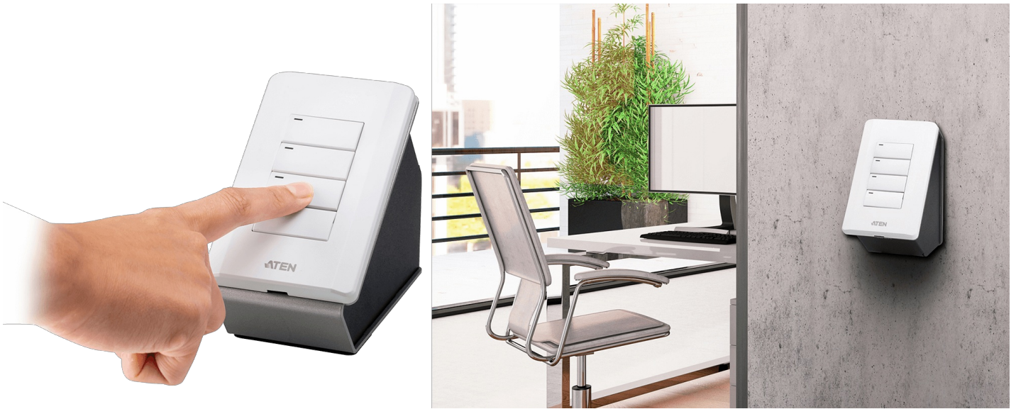
유연한 설치가 가능하여 테이블 위에 놓거나 벽에 장착할 수 있습니다.