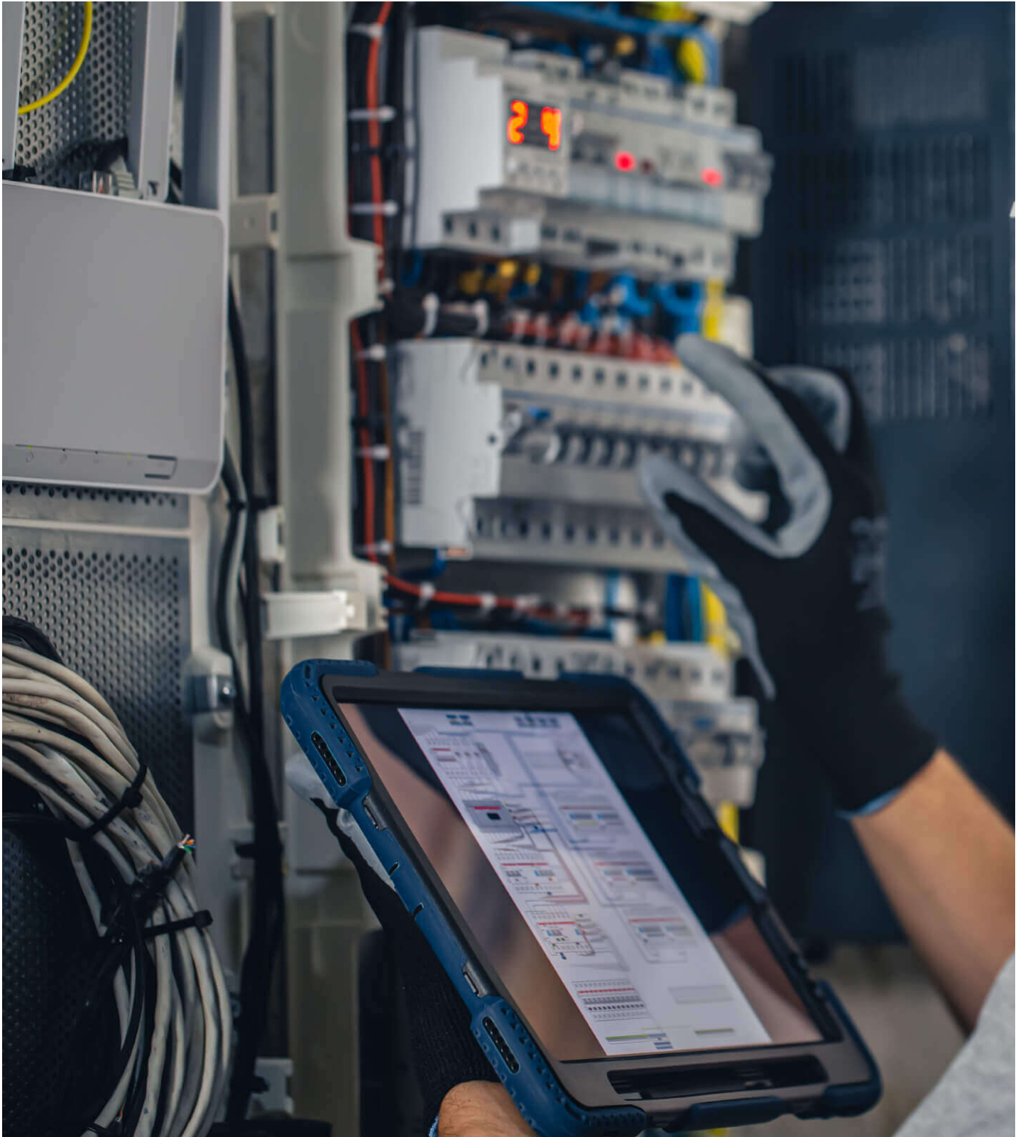
Mantenimiento de equipos heredados