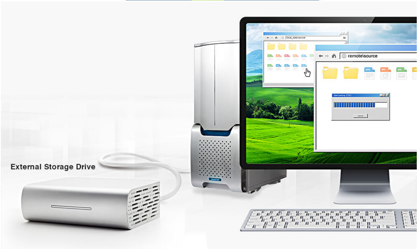
External Storage Drive