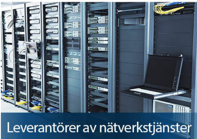
Leverantörer av nätverkstjänster