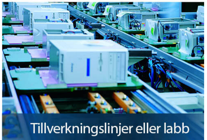
Tillverkningslinjer eller labb