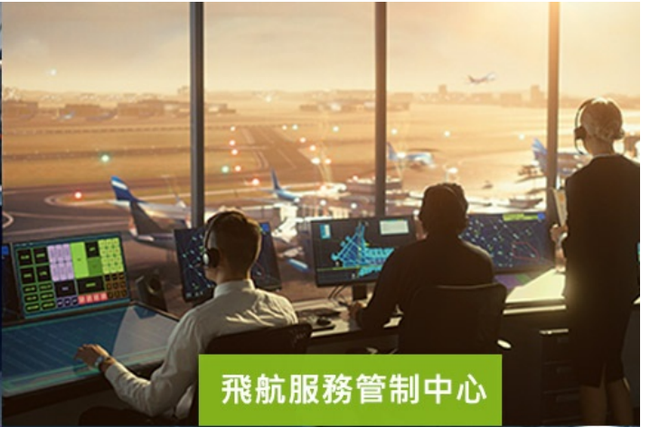
飛航服務管制中心